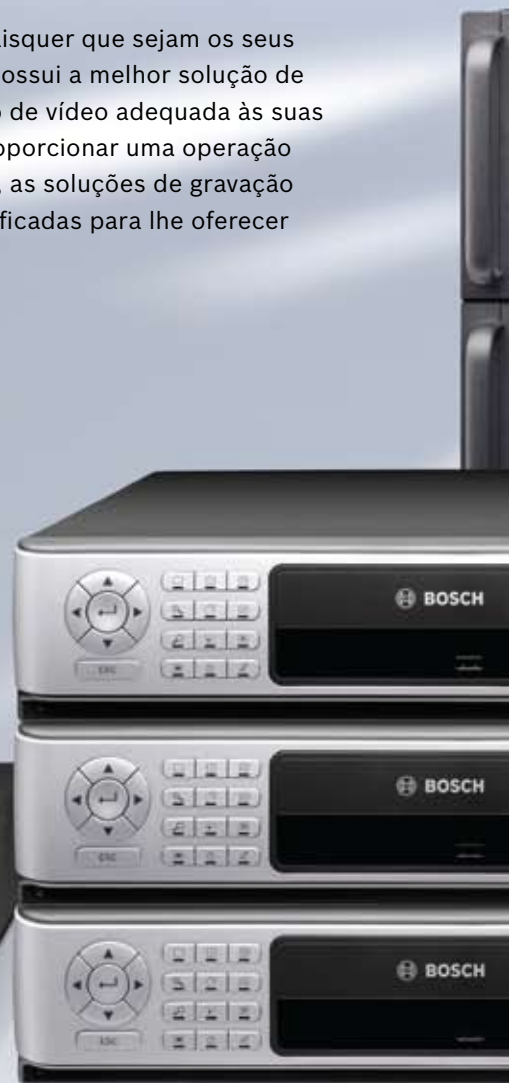
Gravador Divar Híbrido e de Rede da Série 700 2) para aplicações de sistema exigentes