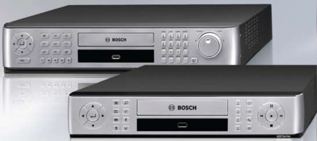
Gravador de Vídeo da Série 400 para aplicações de até 4 câmaras